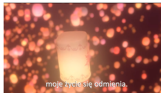
moje życie się odmienia.

Nazajutrz , w wielki dzień, nastrój przypominał nieco atmosferę kermaszu lub święta ludowego. Młodzieńcy organizowali gry i zawody zręcznościowe. Czy dziewczęta szły tańczyć i śpiewać w winnicach, aby przywabić oblubieńców? Talmud zapewnia, że tak było. Pod wieczór podawano posiłek, który mężowie i niewiasty spożywali oddzielnie. Była to chwila wręczenia darów. Oblubienicę otaczały biało ubrane przyjaciółki ( zazwyczaj było ich dziesięć ) i- jeśli zawierzyć słynnej przypowieści o pannach mądrych i pannach głupich- trzymały zapalone lampy . Przyszła małżonka zajmowała miejsce pod baldachimem, jakby królowa , gdyż cały ten ceremoniał był iście królewski. Prawdopodobnie śpiewała wtedy