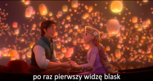
po raz pierwszy widzę blask