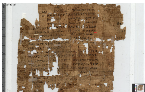
Papirus 1 (data ok 250r.)

do dziewicy, która została zaręczona mężowi, którego imię Josef z domu Dawida, i imię dziewicy Mariam. (Lk. 1:27)