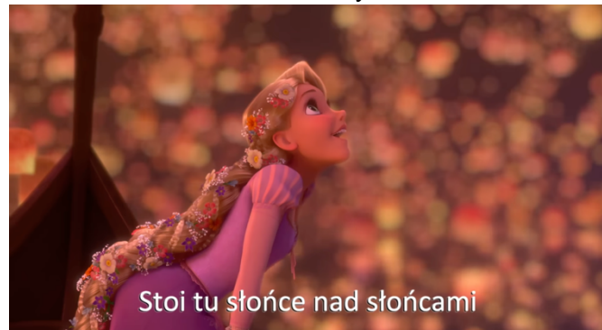
Stoi tu słońce nad słońcami

piękne hymny miłosne z Pieśni nad pieśniami : Niech mnie ucałuje pocałunkami swych ust, bo miłość twa przedniejsza od wina! Pociągnij mnie za sobą! Pobiegijmy! (Pnp 1, 2). Oblubieniec zaś idąc ku niej odpowiadał: